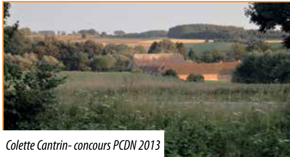
Colette Cantrin- concours PCDN 2013

Dans le Bulletin communal du mois de décembre vous aurez le plaisir de découvrir les photos gagnantes en attendant de les voir, à nouveau, en très grand format le long des routes de nos 3 villages.