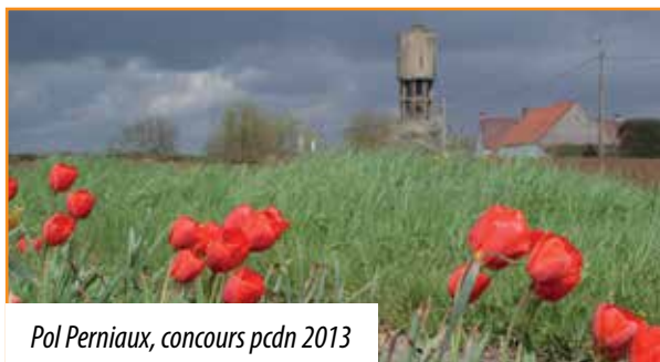
Pol Perniaux, concours pcdn 2013