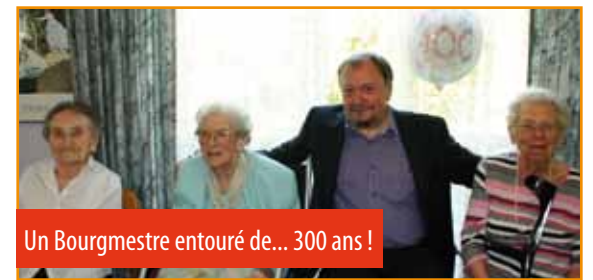
Un Bourgmestre entouré de... 300 ans !