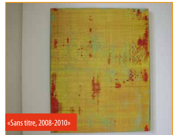
«Sans titre, 2008-2010»

de volumes mais des réceptacles d'émotions engrangées au contact des lumières du jour et des réactions que ces lumières suscitent en lui.