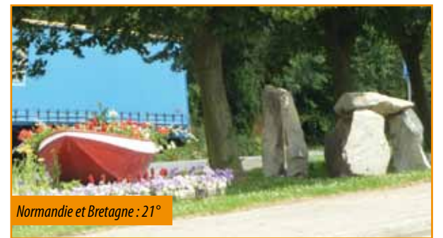
Normandie et Bretagne : 21°