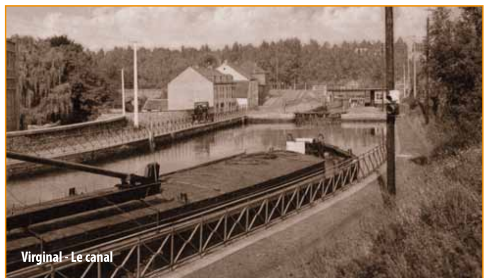
Virginal - Le canal

Les membres du Collège communal toujours à votre écoute. Le personnel de l'Administration communale toujours à votre service.