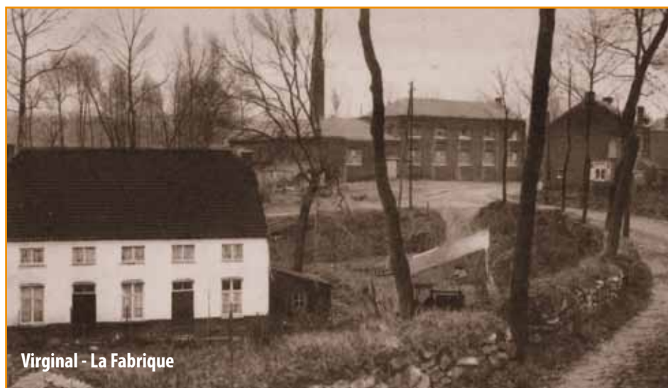
Virginal - La Fabrique