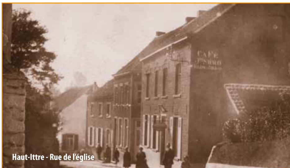
Haut-Ittre - Rue de l'église

> Claude Debrulle, Echevin de l'Information