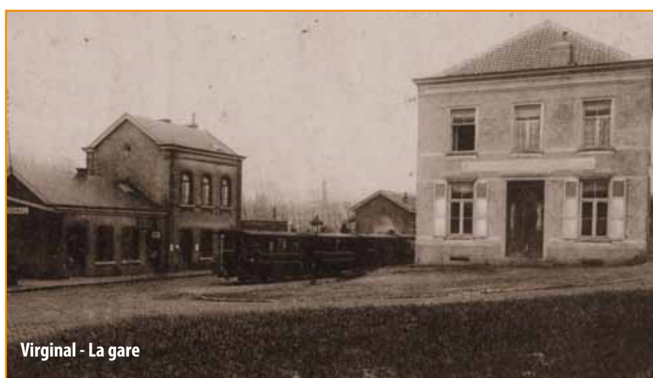
Virginal - La gare