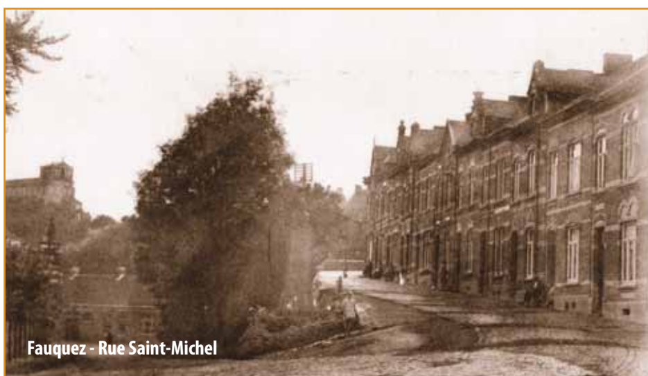
Fauquez - Rue Saint-Michel