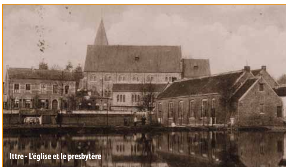
Ittre - L'église et le presbytère