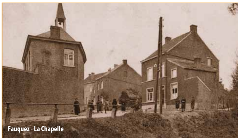
Fauquez - La Chapelle