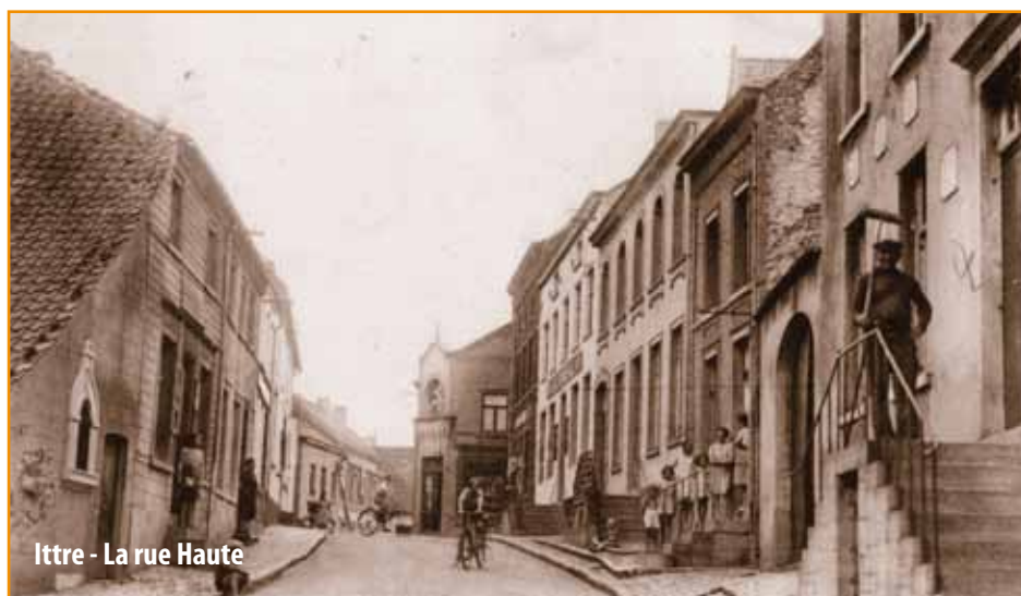
Ittre - La rue Haute