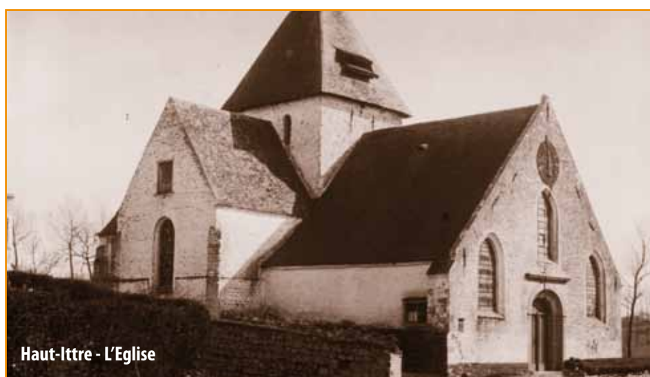
Haut-Ittre - L'Eglise