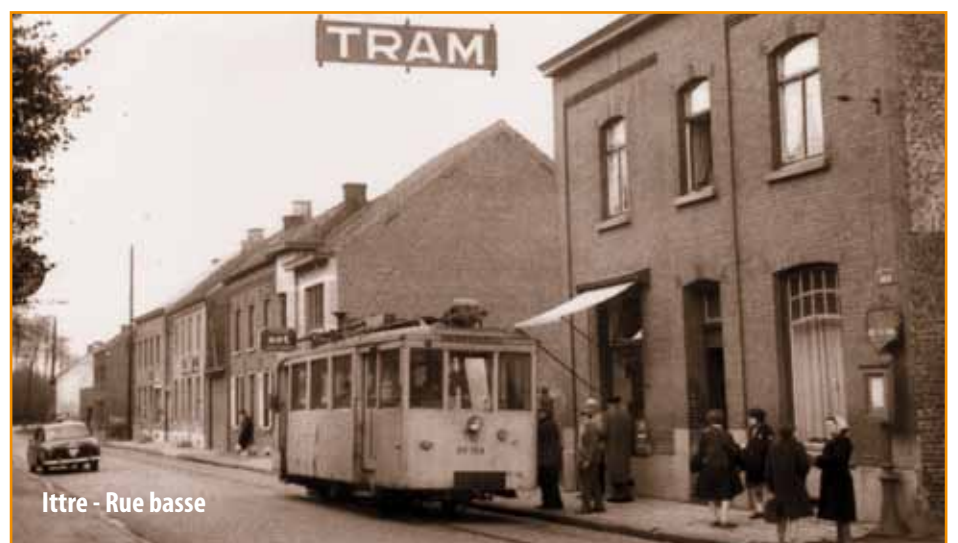
Ittre - Rue basse