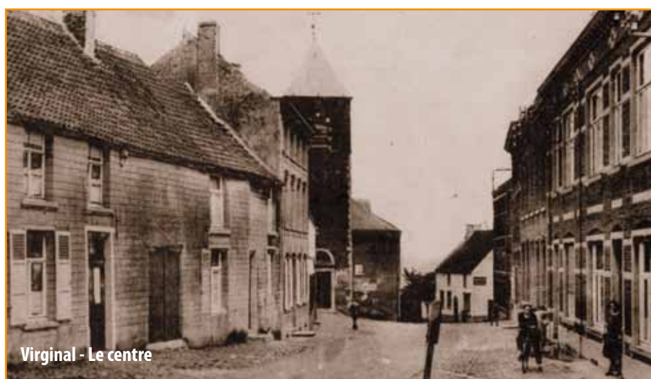
Virginal - Le centre