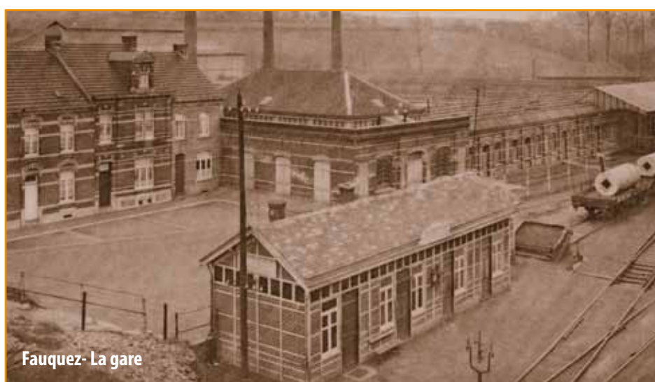
Fauquez - La gare