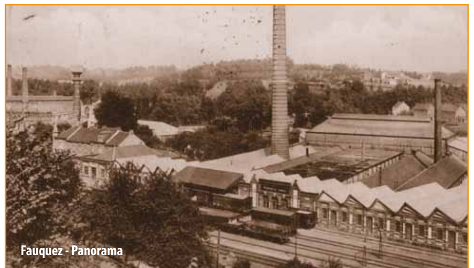
Fauquez - Panorama