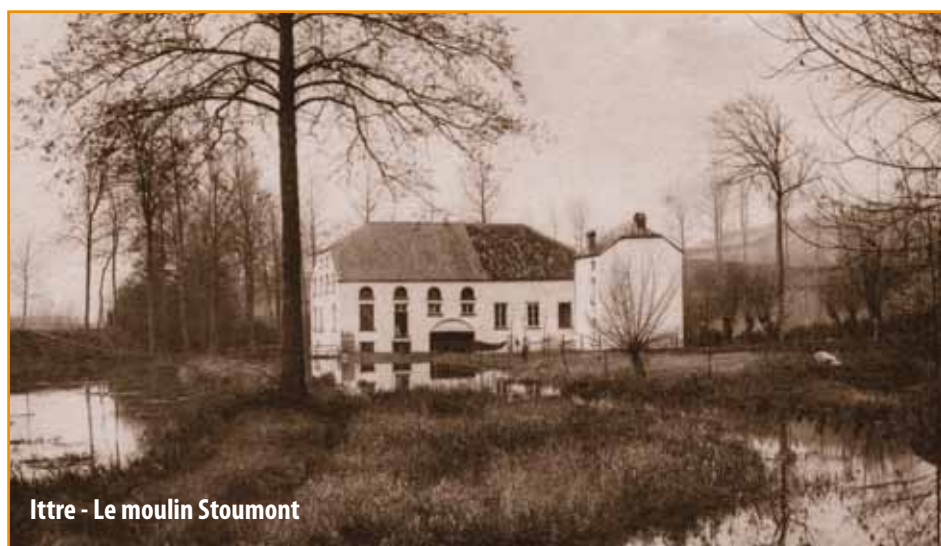
Ittre - Le moulin Stoumont