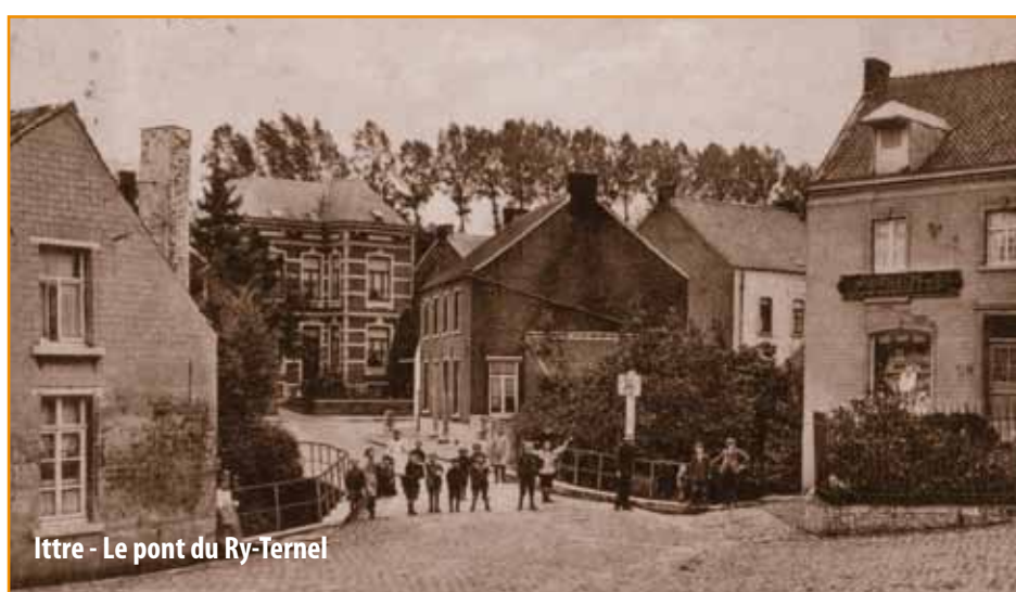
Ittre - Le pont du Ry-Ternel