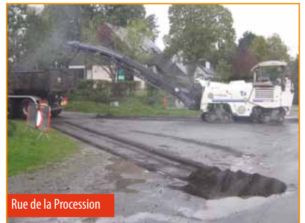
Rue de la Procession