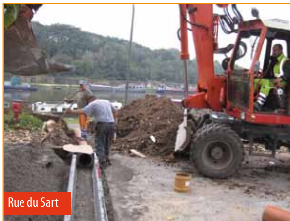
Rue du Sart