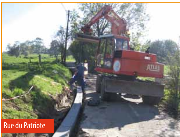
Rue du Patriote