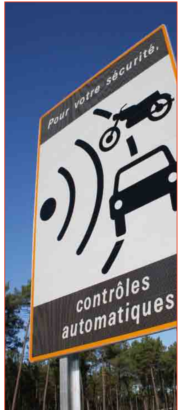
Contrôles de vitesse : mois de mai et juin 2009 à Ittre