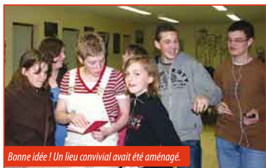
Bonne idée ! Un lieu convivial avait été aménagé.

Un grand merci à toutes les personnes qui se sont investies dans cet événement. A quand la deuxième édition ?