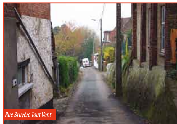
Rue Bruyère Tout Vent

Ce collecteur permettra de refaire les égouts et la voirie des rues Bruyère Tout Vent, Catala, Laverland. Dès mon arrivée, j'ai demandé et obtenu que la rue Emile Nils soit ajoutée au plan initial.