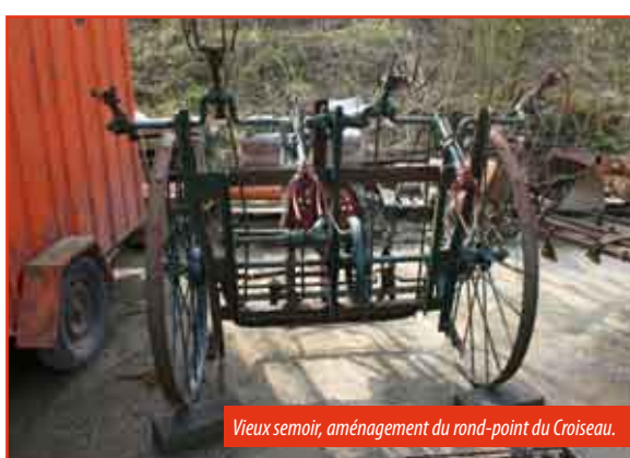
Vieux semoir, aménagement du rond-point du Croiseau.