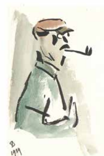
Guillaume Vanden Borre, Sans titre, 1929, aquarelle sur papier. Don de Jacques Lacomblez.

Jeudi et samedi de 13 à 17 heures, dimanche de 11 à 17 heures et sur rendez-vous (0471 21 63 88)