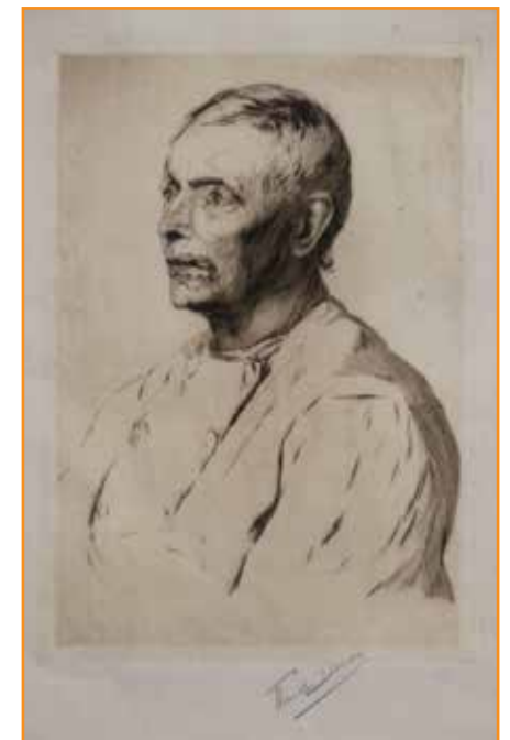
Portrait d'un homme, non daté (avant 1915)