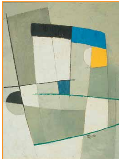
Intuition n° 10, 1957