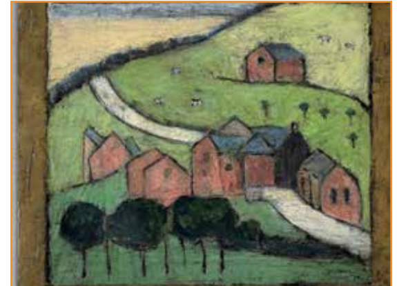
Groupes de maisons à Ittre, 1924