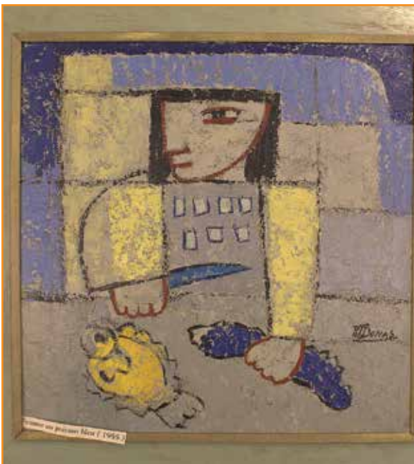
Femme au poisson bleu, 1955