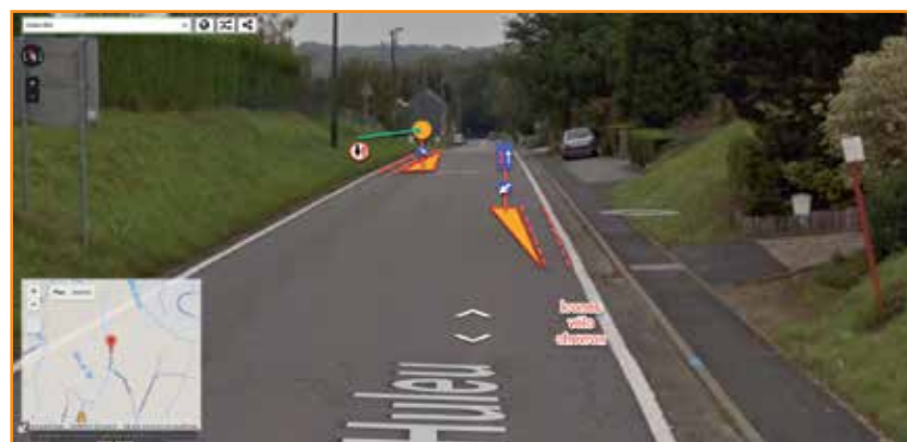
Rue de Huleu n°51