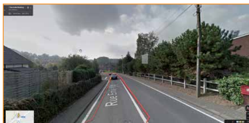
Rue Emile Montois