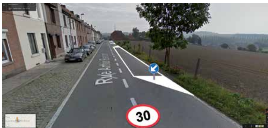
Rue Arthur Brancart (30)

Sont concernées : les rues de Huleu, du Croiseau, de Clabecq, Montois, Planchette, de Baudémont, du Rouge Bouton, du Roelux, Maurice Brancart, Arthur Brancart, du Bois de la Houssière, du Pré de l'Aite.