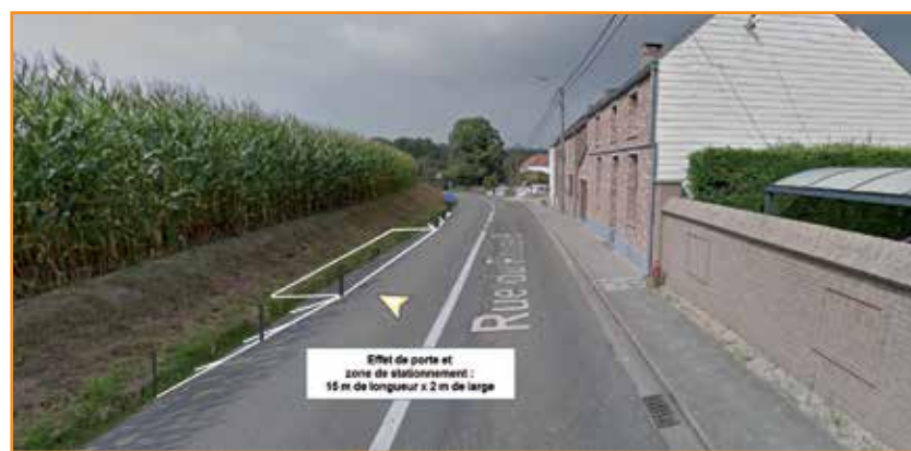
Rue Rouge Bouton