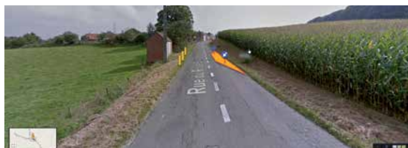
Rue Rouge Bouton