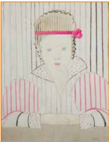
Marthe DONAS, La jeune fille au ruban rouge, 1922 Huile sur toile, 65 x 50 cm - Achat du musée grâce à un mécénat privé

> Hélène de Schoutheete, Echevine de la Culture