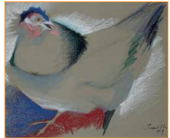
Roger SOMVILLE, La poule, 1959 Pastel sur papier kraft, 46 x 61 cm - Don de Thérèse Denoël-Cleempoel