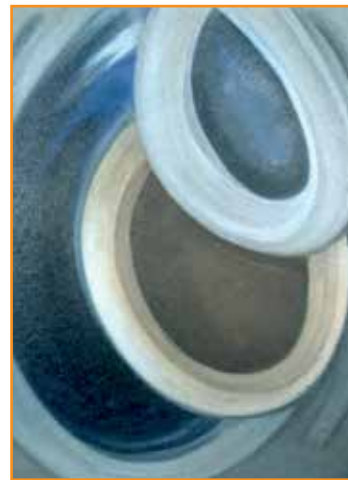
Berthe DUBAIL, Dans l'espace et dans le temps, 1974-75 Huile et sable sur toile, 100 x 81 cm, (d'après une gouache de 1962) - Inv. n° 779 - Don de Ginette Blondiaux