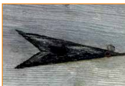
Laurence Bastin - Le sens de la vie