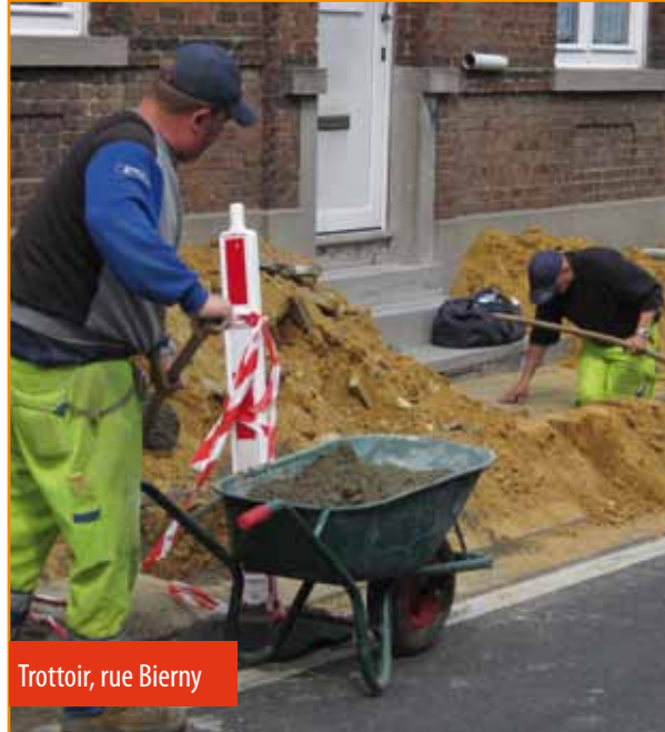
Trottoir, rue Bierny