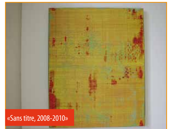
«Sans titre, 2008-2010»

de volumes mais des réceptacles d'émotions engrangées au contact des lumières du jour et des réactions que ces lumières suscitent en lui.