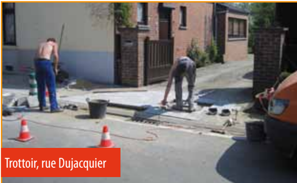
Trottoir, rue Dujacquier

Un effort particulier a été effectué dans plusieurs rue de Virginal afin de réparer et entretenir les trottoirs. Nous avons profité de ce travail pour raccorder les dernières maisons de la rue Charles Catala au réseau d'égouttage.