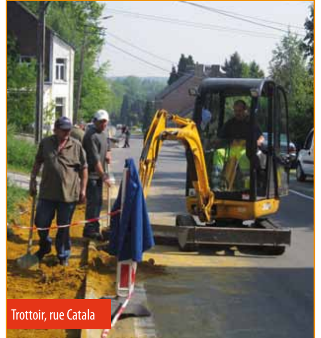
Trottoir, rue Catala