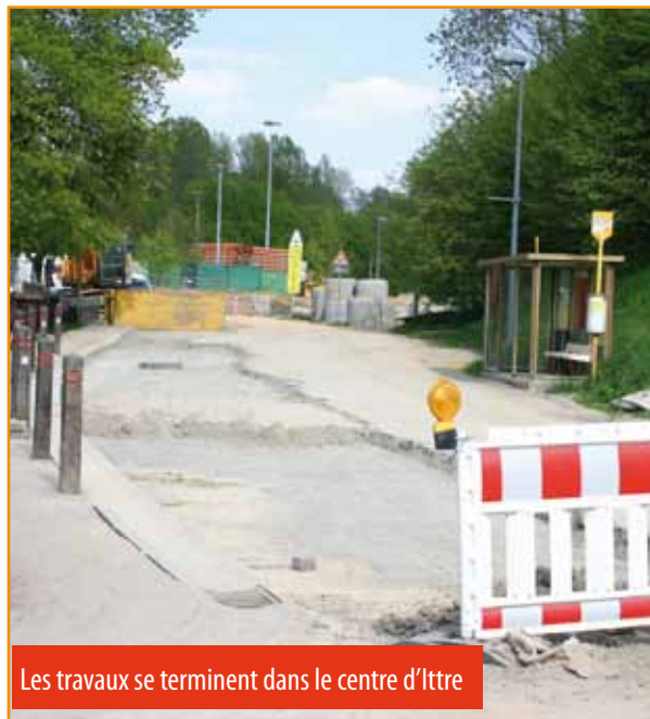
Les travaux se terminent dans le centre d'Ittre