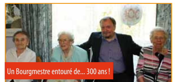
Un Bourgmestre entouré de... 300 ans !