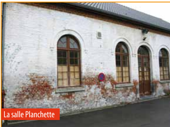
La salle Planchette

Il s'agit d'une salle très utilisée qui a un besoin urgent d'aménagements.