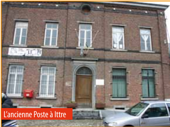
L'ancienne Poste à Ittre