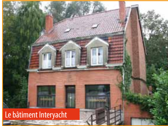
Le bâtiment Interyacht

Le but de cet achat est d'accroître le parc de logement public dans la Commune et qui répond à un besoin criant.