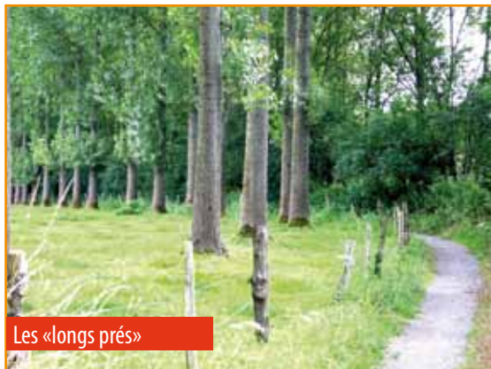
Les «longs prés»

Cet investissement trouve sa justification dans l'amélioration de la mobilité douce au cœur du village et à la protection piétonnière dans le quartier de Fauquez.