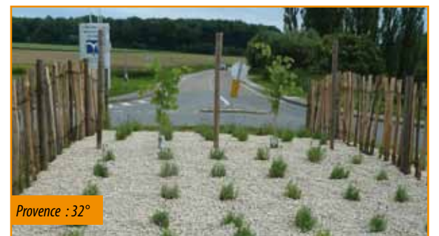
Provence : 32°

Mais nous nous accueillerons nos amis d'Ecueillé à la fin août pour fêter nos vingt ans de jumelage avec une chaleur indescriptible.