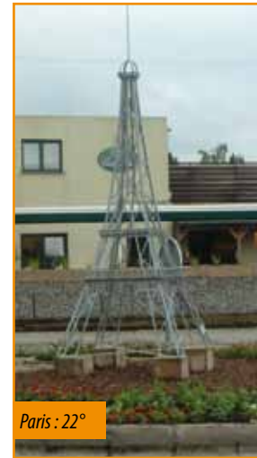
Paris : 22°

Eh oui, le soleil n'est pas là au début de ces vacances, pour mettre un peu de baume sur votre cœur, nous avons fait venir chez nous, les régions de France.