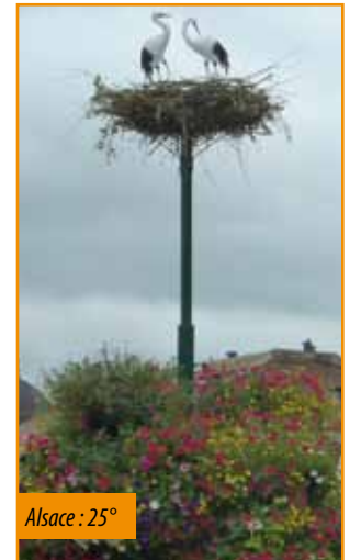
Alsace : 25°