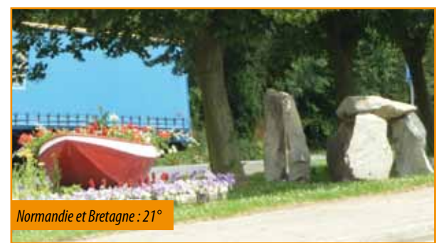
Normandie et Bretagne : 21°