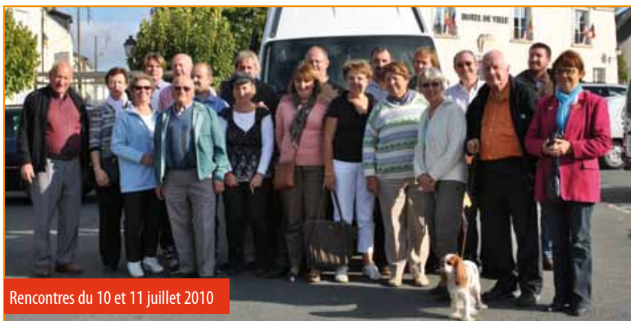
Rencontres du 10 et 11 juillet 2010