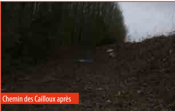
Chemin des Cailloux après