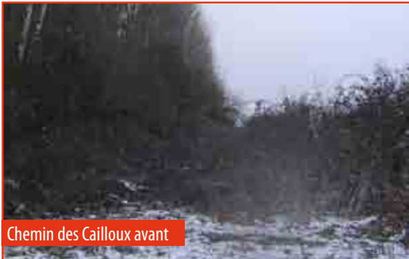
Chemin des Cailloux avant

Un gros travail de déblaiement, d'abattage et de débroussaillage a eu lieu entre le chemin des Cailloux et le Chemin de Schoot afin de réhabiliter le Vieux chemin de Nivelles séparant les anciennes communes d'Ittre et d'Haut-Ittre. Nous avons également préservé dans ce travail une vieille haie permettant un refuge pour les oiseaux et animaux dans cette vaste plaine.