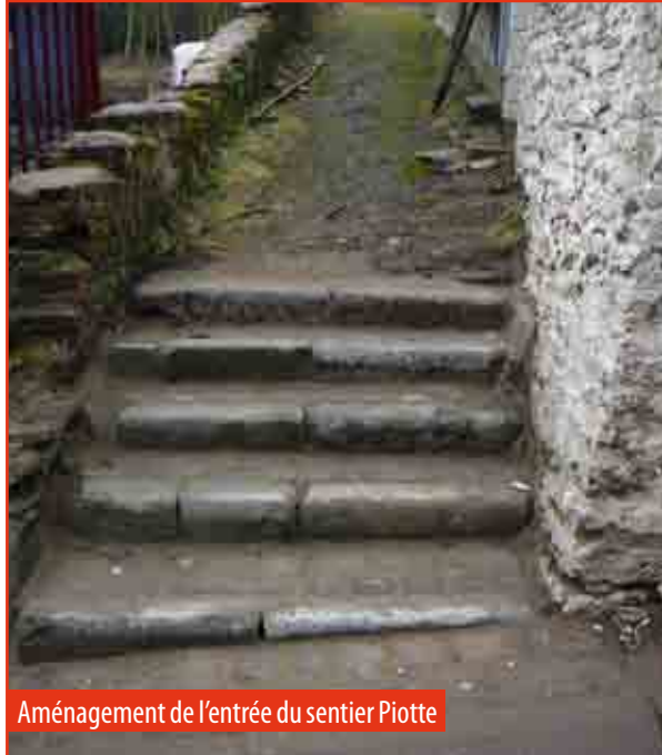
Aménagement de l'entrée du sentier Piotte