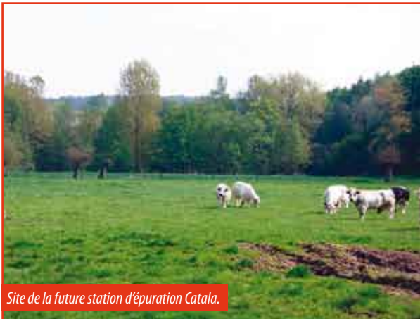
Site de la future station d'épuration Catala.

L'IBW pour tout ce qui concerne les travaux d'assainissement des eaux usées avec la création d'une station d'épuration derrière le site Catala. Cette station d'épuration d'une capacité de 6500 équivalents/habitants traitera une grosse partie de notre commune.