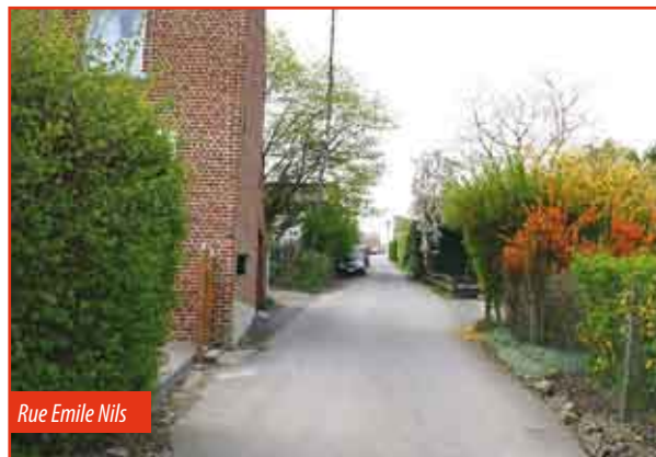
Rue Emile Nils

Pour Ittre, les travaux suivront de très près car la station d'épuration doit être fonctionnelle le plus vite possible. Cela nécessitera la mise en place d'un collecteur (deuxième branche) reprenant les égouts de Huleu, de Ittre et ensuite de Haut-Ittre. Il s'agira aussi de travaux importants notamment pour la traversée du village d'Ittre. Actuellement, le cahier de charge est en cours d'élaboration et sera