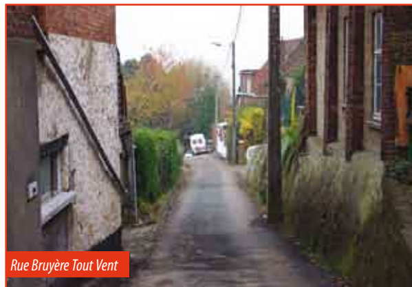
Rue Bruyère Tout Vent

Ce collecteur permettra de refaire les égouts et la voirie des rues Bruyère Tout Vent, Catala, Laverland. Dès mon arrivée, j'ai demandé et obtenu que la rue Emile Nils soit ajoutée au plan initial.