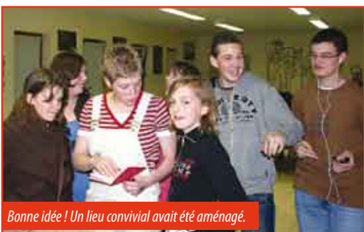
Bonne idée ! Un lieu convivial avait été aménagé.

Un grand merci à toutes les personnes qui se sont investies dans cet événement. A quand la deuxième édition ?