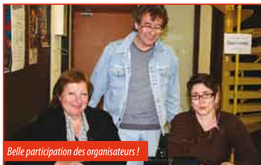
Belle participation des organisateurs !