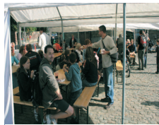
Et enfin la détente.

Dans (presque) toutes les communes de la Région wallonne, la journée du 21 septembre fut une journée sans voiture dans le centre des villes et villages. En apothéose de la «Semaine de la Mobilité 2008», cette journée a été placée sous le signe des déplacements doux, des usagers faibles, des autres modes de déplacements.