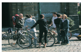
Rendez-vous l'année prochaine pour la 4 ème édition.