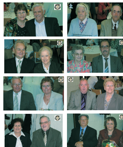
Et les heureux jubilaires de Virginal