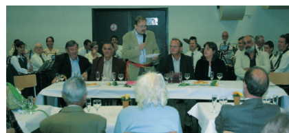
L'accueil par les autorités communales