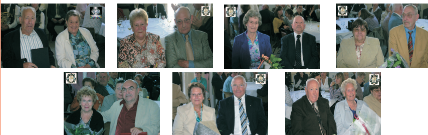
Les heureux jubilaires d'Ittre