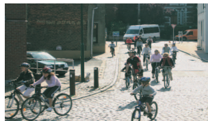
la fin du peloton...à l'arrivée.