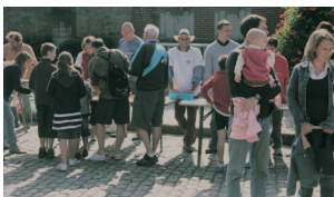
On a fait la file ce jour-là !