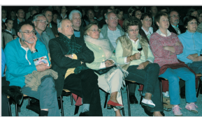
Un public nombreux et attentif

Ce « petit jeu sans conséquence » a été créé en 2002 à Paris. Il a obtenu, en 2003, le prix Molière comme le meilleur spectacle de création et a été adapté au cinéma en 2004 par Bernard RAPP (avec Yvan ATTAL et Sandrine KIBER-LAIN.)