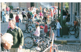
Après l'effort, la restauration.

Coordonnées par Frédérique Joris (promenade vélo) et par Michel Gossiaux (promenade à pied), cette journée fut un succès salué par un temps estival tout à fait propice à la pratique de ces activités.