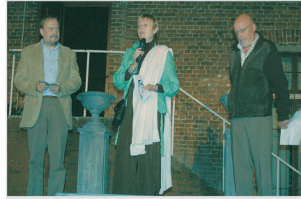
Des discours...pour la bonne cause